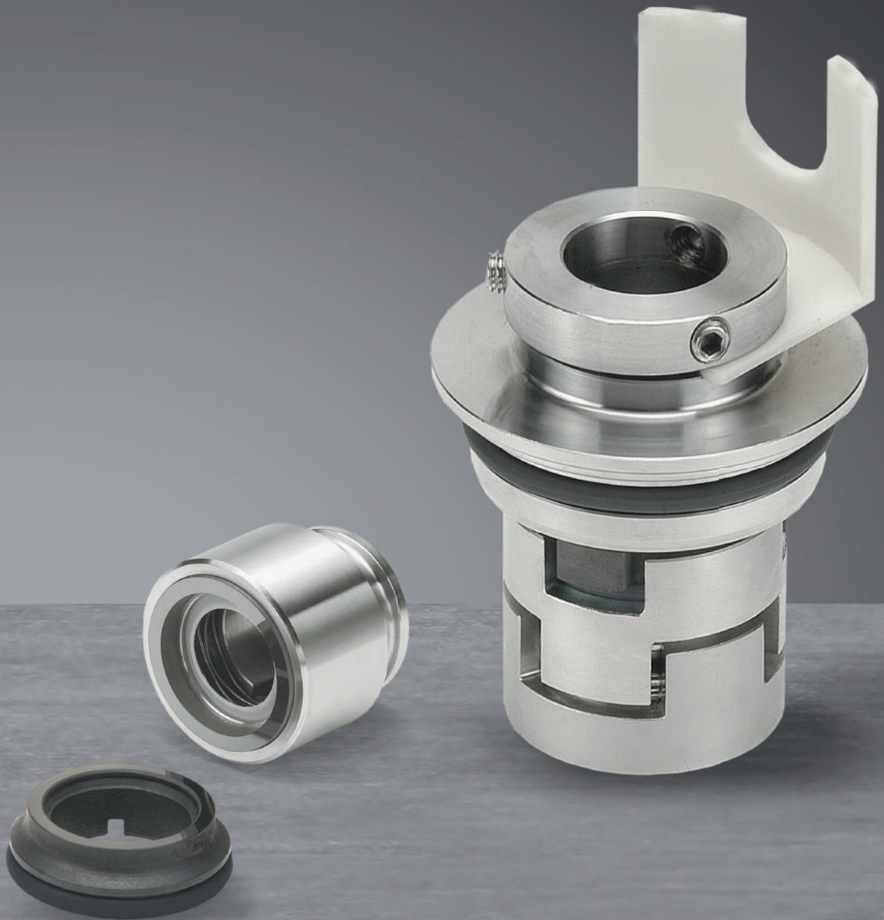
Garnitures Mécaniques RMS